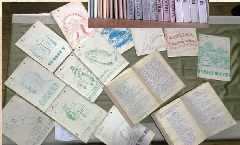
Книги, написанные Симо Ралевичем